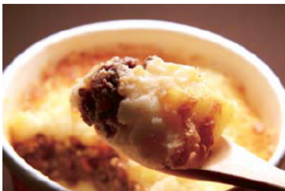
じゃが芋と牛挽肉の 重ねチーズ焼き