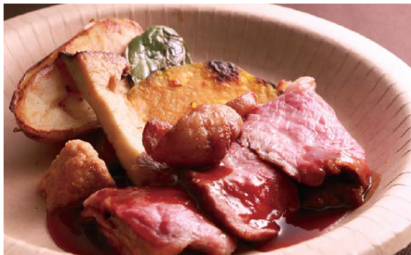
牛肉バーベキュー盛り合わせ