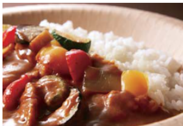
くるるの杜大通食堂の 北海道野菜カレー