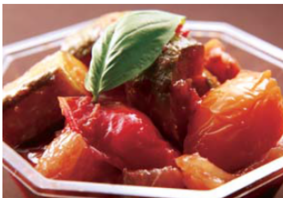
北海道野菜を使った 野菜のトマト煮込み(ラ外ウイユ)