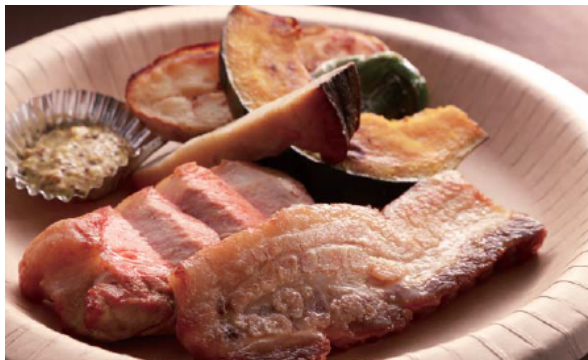
豚肉バーベキュー盛り合わせ