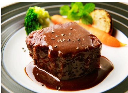
道産牛ホホ肉のとりけるシチュー

北海道の人気レストランや老舗寿司店とのコラボレーションでホクレン大収穫祭限定商品を販売。