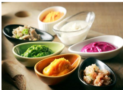
道産えびすかぼちゃのクリームニョッキ ～緑の野菜の自家製ディップ添え～