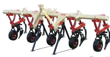
Photo : NCK-5

ADKの2.5倍のフレーム強度で、サブソイラーなみに畦間を深く中耕できる深耕カルチベーターとして登場。以来、全国各地でご使用いただいております。(3畦タイプもございます。)