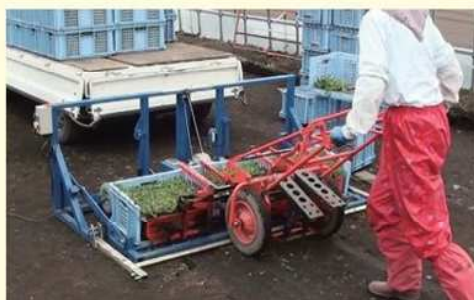
苗箱に苗をセットしフットスイッチを踏むと苗箱がリフトアップします。