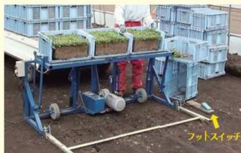
腰を曲げずに苗箱を持てるのでとっても楽チン!!(※写真はSLタイプです)