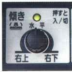
傾斜制御ボリューム