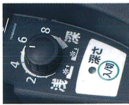
耕深制御ダイヤル