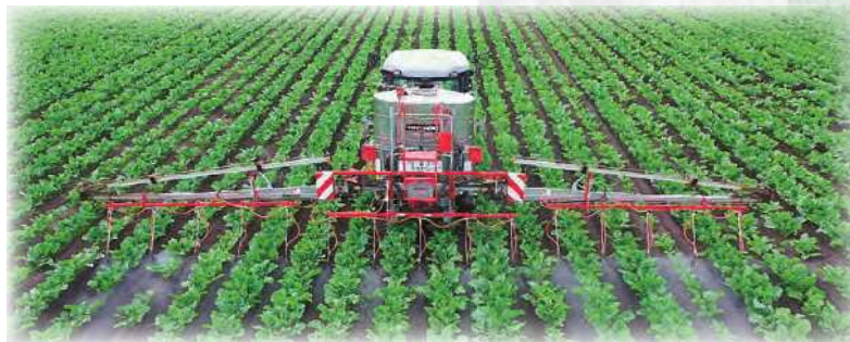
H-15KV(ブームに直装)片竿散布にも対応可能