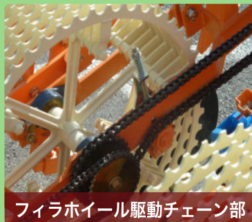
フィラホイール駆動チェーン部