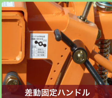
差動固定ハンドル