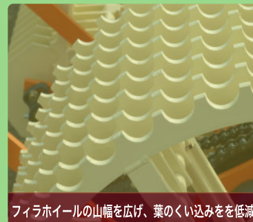
フィラホイールの山幅を広げ、葉のくい込みを低減