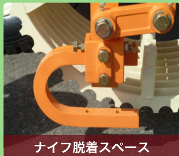
ナイフ脱着スペース