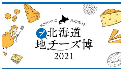
(プチーズ博 ビジュアル)

北海道地チーズの日替わり食べ比べセットの提供や、 3個以上地チーズを購入いただいた方へオリジナルエコバックを プレゼントするキャンペーンを実施いたします。