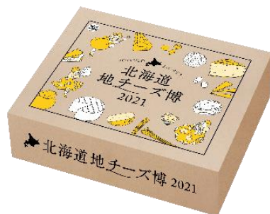
(おすすめセットBOX イメージ)

また、カッティングボードやグラス等、チーズの時間がもっと楽しくなる 地チーズ博オリジナルグッズを販売いたします。