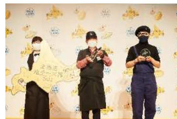
「北海道地チーズ博総選挙 2022」 授賞式の様子

昨年は、デザートチーズ二世古 雪花[sekka]パパイア&パイナップルがグランプリを受賞しました。