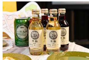
会場で提供予定の「小樽麦酒」、 はこだてわいん「年輪」