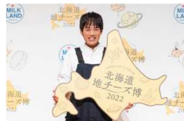
森崎博之さん (『北海道地チーズ博 2022』より)

『北海道地チーズ博 2023』開幕にあたり、ホクレンアンバサダーを務めるTEAM NACS 森崎博之さんをお迎えし、チーズプロフェッショナルの石川尚美さんと共に北海道地チーズの魅力を語り尽くす特別トークセッションを開催します。