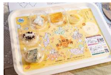
「セレクト5」「セット5」の提供イメージ

各出店社オススの全46種の地チーズの中から、お好みに合わせて5種類を選択できます。