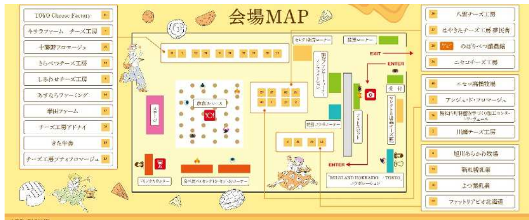
会場 MAP(出店工房・メーカー記載)